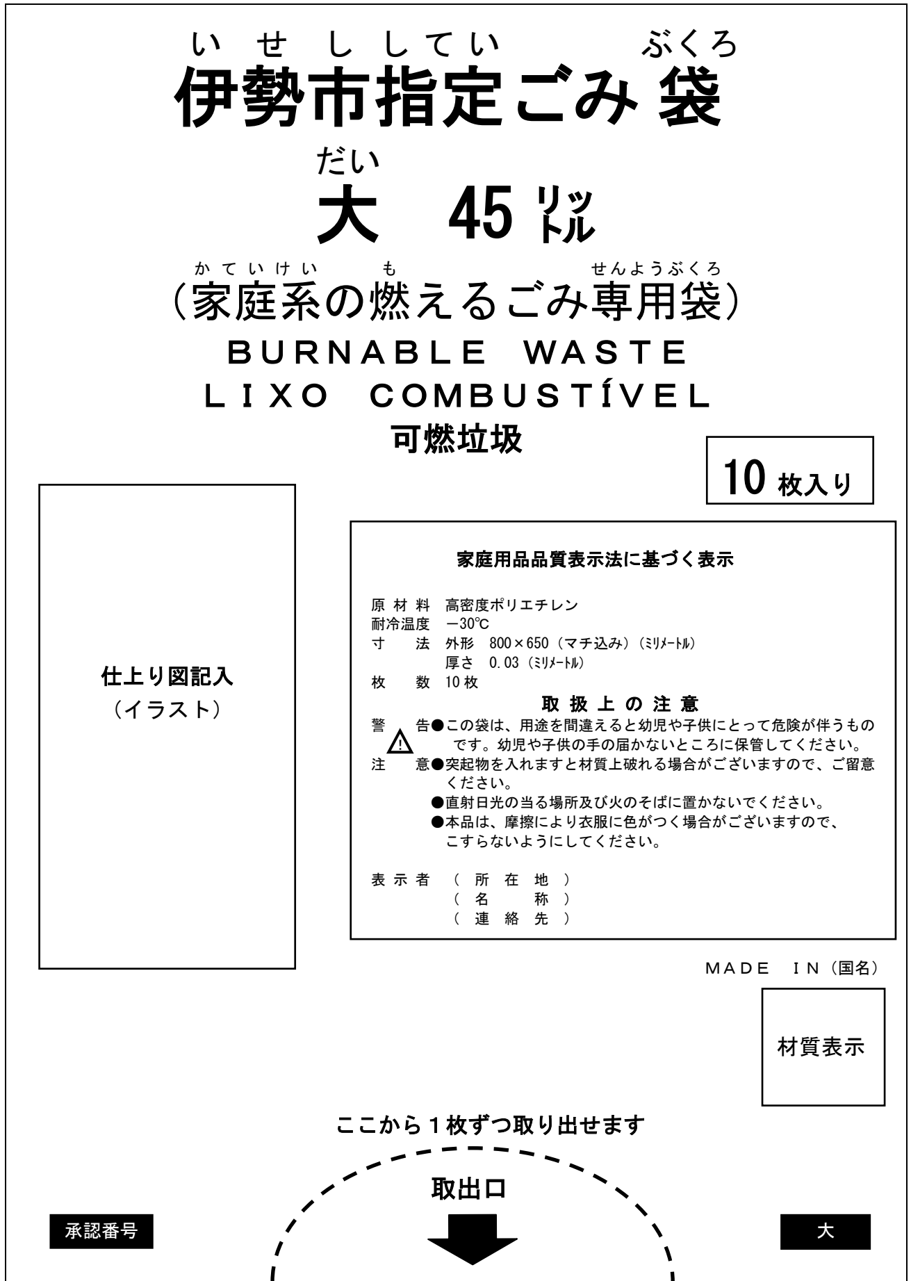
別図2 (印字例: 大)